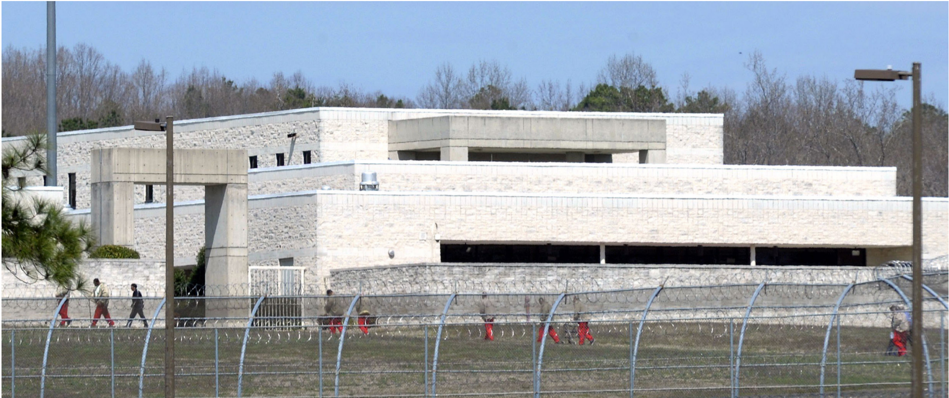
"בכלא מעריכים דברים מטוימים שאנשים בחברה נורמלית לא מבינים". כלא באטנר בצפון קרוליינה, שאליו הועבר פולארד ב־1994