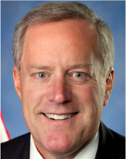
התנייס למענו. מדחז

"בשלב הזה אין שום דבר שאני יכול לעשות. היתה עלי הסכין שהחוקתי להגנה עצמית, אבל אני אהיה מת לפני שאשלוף אותה. אמרתי קריאת שמע והמשכתי ללכת במסדרון. לא הסתכלתי